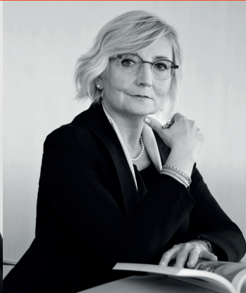
Cinzia Tagliabue presidente del Consiglio di amministrazione di Amundi Sgr